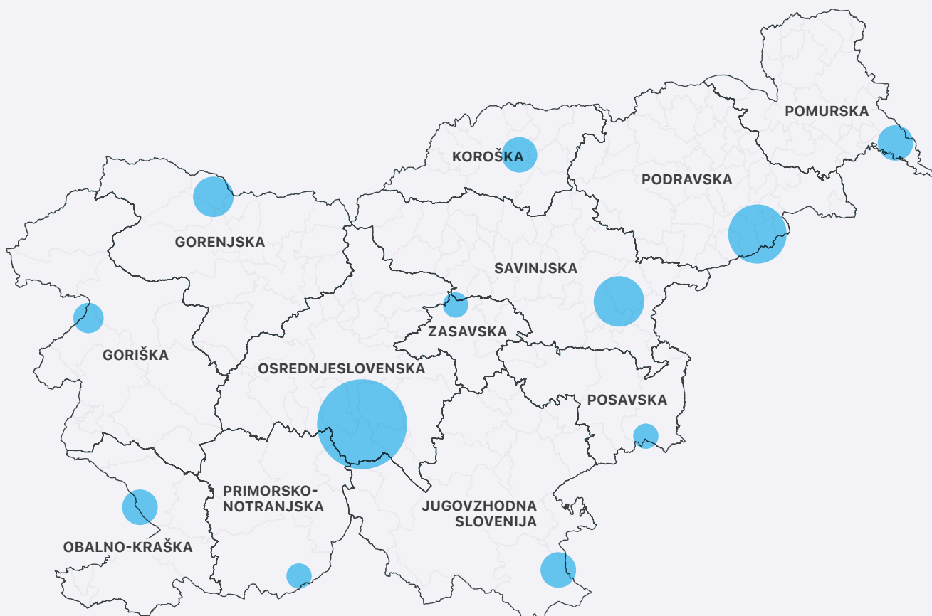
Slika 1: Prikaz števila prostovoljskih organizacij in organizacij s prostovoljskim programom, ki so vpisane v vpisnik v letu 2022, po statističnih regijah v Sloveniji